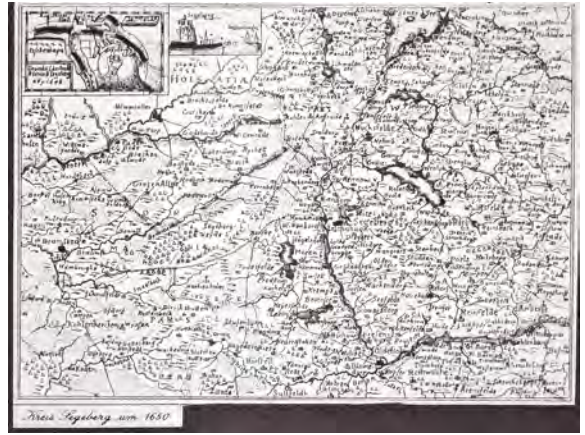
1650 Karte des Kreises Segeberg