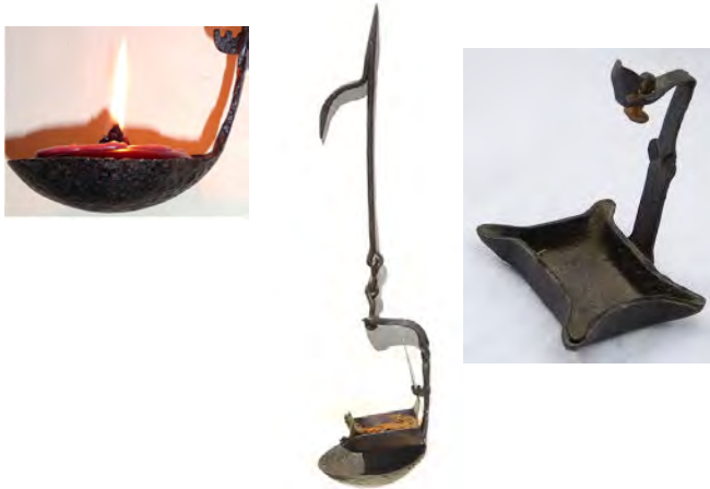
Krüsel, Öllampen, 17. Jahrhundert

Der Dreißigjährige Krieg hat Zerstörung und Elend auch nach Leezen gebracht. Die Feldherren Wallenstein und Tilly zogen auf dem Weg nach Dänemark durch Holstein. Wallenstein besetzte Oldesloe und Segeberg. Um Plünderungen zu entgehen mussten die Städte sein Heer von 50 000 Söldnern versorgen und deren Sold bezahlen. Es ist wohl davon auszugehen, dass auch Leezen darunter zu Leiden hatte.