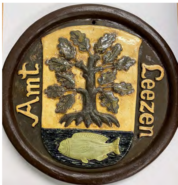
Das Original ist zum Aufhängen aus Ton

Zum 10-jährigen Jubiläum des Amtes Leezen wird ein Wappen vorgestellt