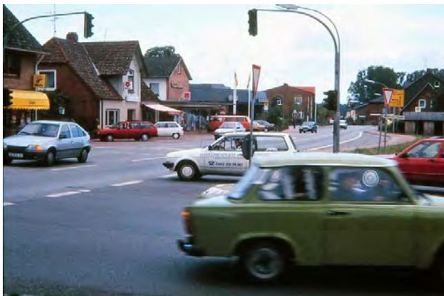
Hamburger – und Neversdorfer Straße

Die Jahresrechnung der Gemeinde schließt ab mit einer Einnahme von 165592 DM und Ausgaben von DM151499.