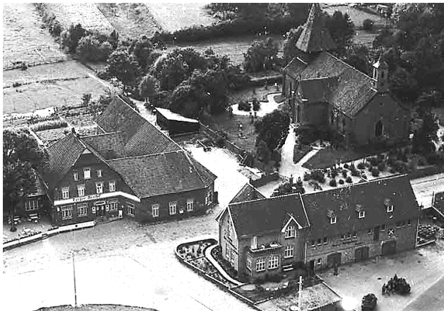
Kirche, Hotel Teegen, Spar- und Darlehnskasse

Die Schule wird von 322 Kindern besucht. Die Zahl steigt weiter an als Folge des anhaltenden Flüchtlingsstroms.