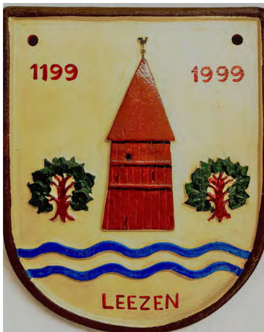
Das Original aus Ton

Das Wappen der Gemeinde wird vorgestellt