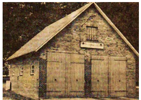
Das Feuerwehr Gerätehaus von 1888

Schulzentrum Leezen wird für 1,2 Millionen Euro weiter ausgebaut. Der Förderschulbereich ist um ein Stockwerk mit sechs Klassen aufgestockt worden.