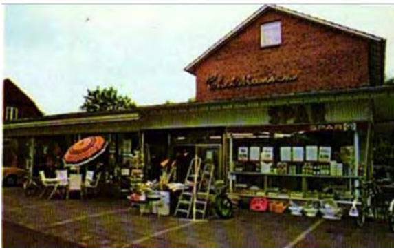
Kaufhaus Christiansen-Sarau gibt auf