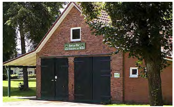
Dorfgemeinschaftshaus und Dorfarchiv

Wasserbüffel finden eine neue Heimat im 211 ha großen Landschaftsschutzgebiet in der Leezener Auenniederung.