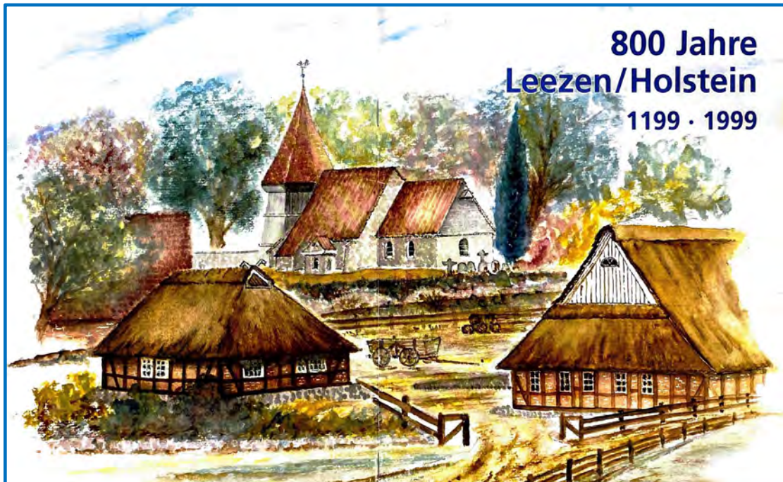
Gezeichnet von Ernst Geise, 1997

Leezen feiert den 800. Jahrestag mit einer Festwoche und vielen Veranstaltungen.