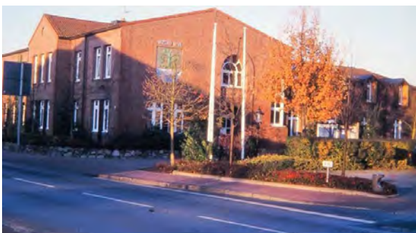
Das neue Amtsgebäude, ehemals Stadt Hamburg

Grünes Licht für den Umbau des Hotels Stadt Hamburg zum Amtsgebäude. Finanzierung des 1,7 Mio. teuren, abgespeckten Bauvorhabens steht.